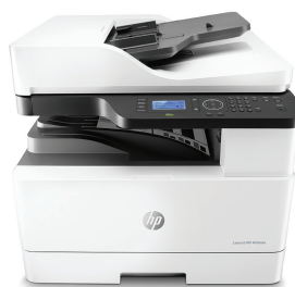
Stampante multifunzione HP LaserJet M436nda

Aumentate le vostre possibilità di lavoro con questa stampante multifunzione A3 efficiente, affidabile e dal costo contenuto. Flussi di lavoro semplificati grazie a soluzioni di copia e scansione efficienti con connettività di rete e monitoraggio da remoto. 1 Risparmio di tempo e risorse con funzionalità di gestione automatica della carta. 2,3