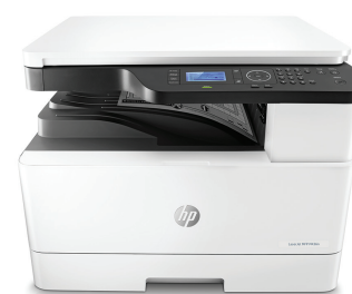
Stampante multifunzione HP LaserJet M436dn